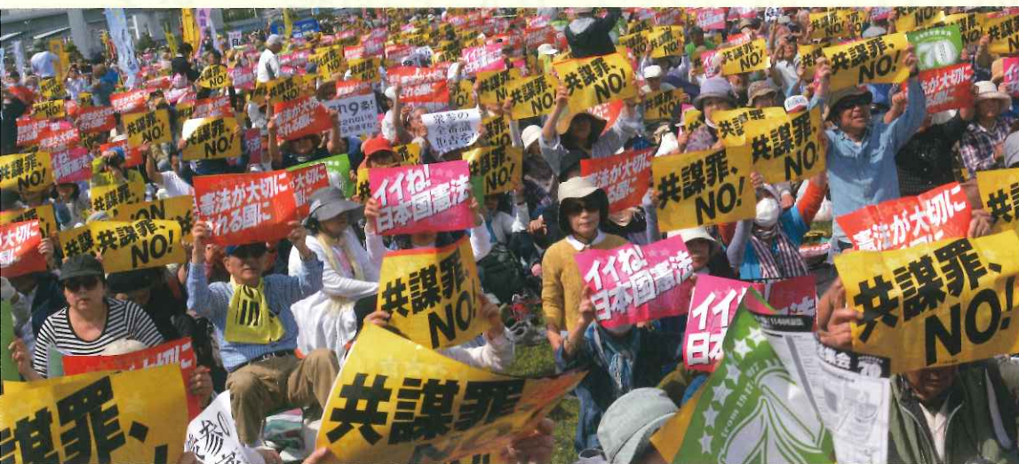
2017年「施行70年、いいネ！日本国憲法5・3集会」5万5000人参加（東京・有明防災公園）

“安倍9条改憲”反対の一点で手をつなぎましょう。3000万人の「戦争はイヤだ」の声を集めて、9条を未来につないでいきましょう。