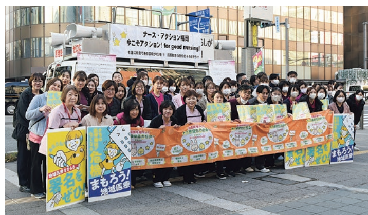
70名が参加した「秋の宣伝行動」

11月29日(土)の博多駅前博多口で福岡県内より看護師や労働組合員等が集まり、「秋の宣伝行動」を70名の参加で行いました。約10名の看護師たち「(家族が)医療従事者が、次々に病院・診療所の経営状況や看護現場の深刻な実態等についてリレートークしながら、「地域医療を守れ」の署名に取り組み、45分間で署名を131筆集めました。署名入りティッシュ360個、チラシ170枚も配布し、メディア取材は1社のみでしたが大いに盛り上がりました。署名に応じた通行人の中には「診療所や病院が潰れたら困る」「(家族が)医療従事者で人が足りないといつも言っている」等、次々と立ち止まり、親子で署名に協力してくださる方も少なくありませんでした。