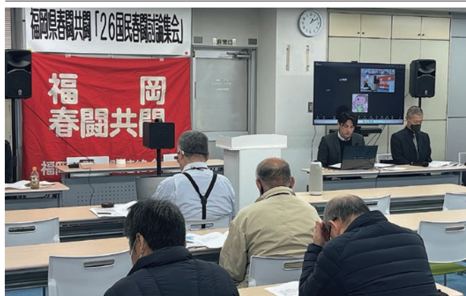
福建労東西支部会館にて春闘討論集会

2026年春闘の重点課題として、①実質賃金の底上げ実現、②労働法制改悪阻止と労働時間短縮の実現、③公共と社会保障の再生、④平和維持を求める行動の強化の4点が提案されました。